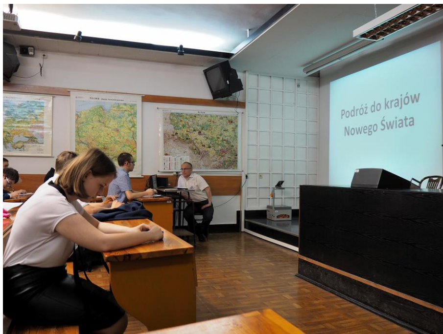
II etap konkursu