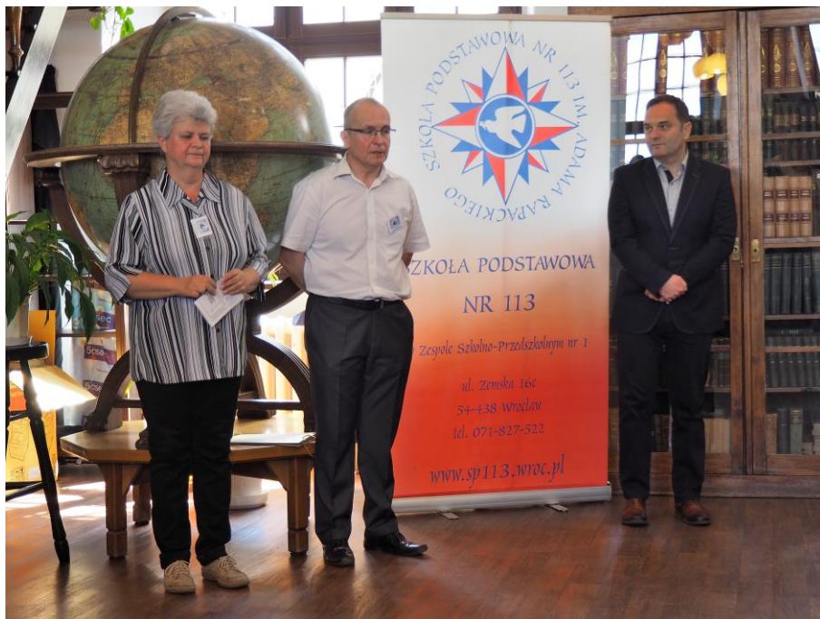
Ogłoszenie wyników I etapu konkursu