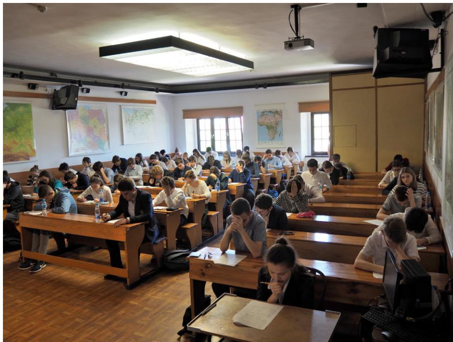
I etap konkursu ...