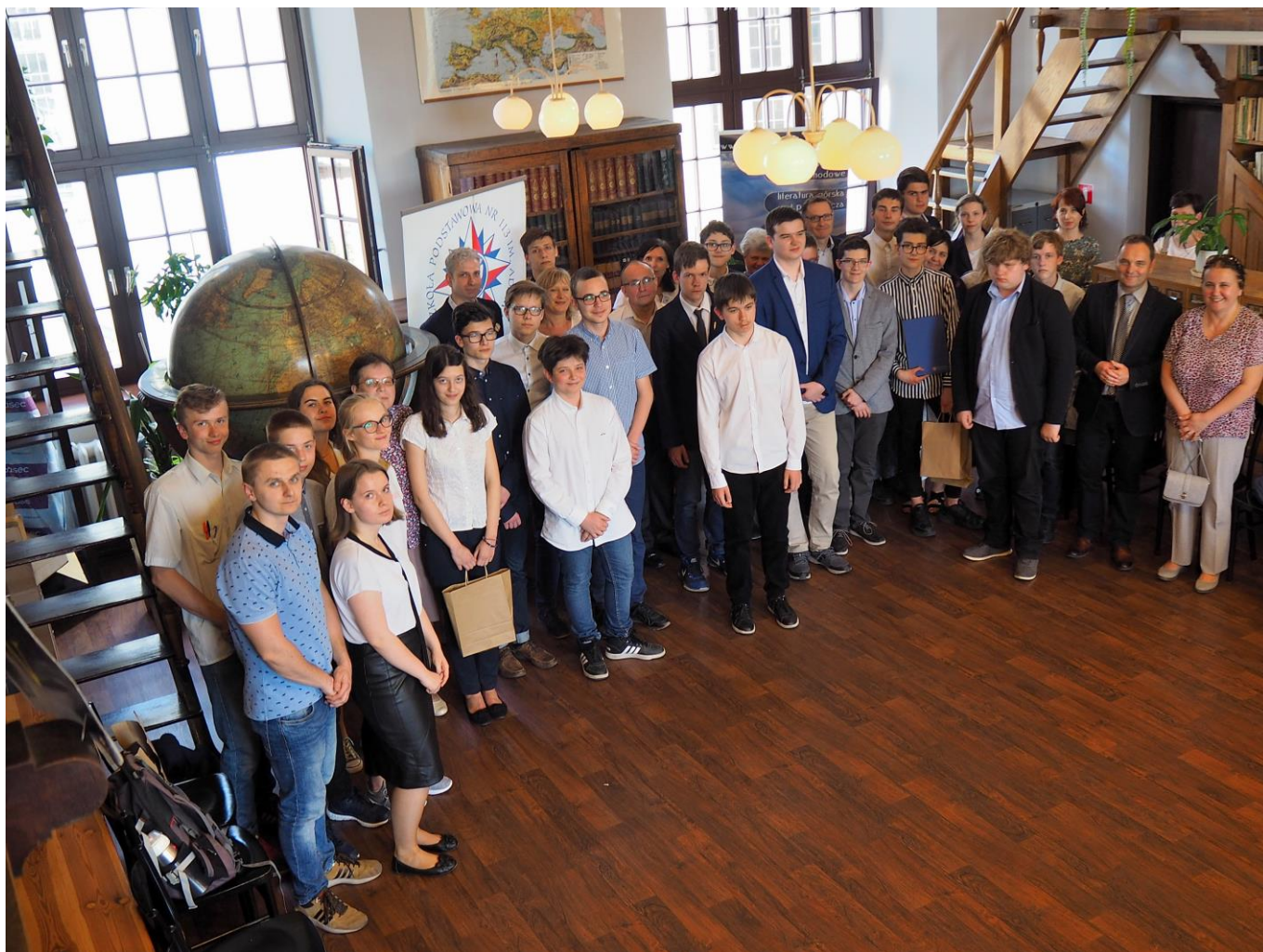
Finaliści V Olimpiady Geograficznej wraz z opiekunami.